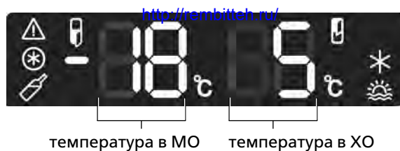
температура в МО